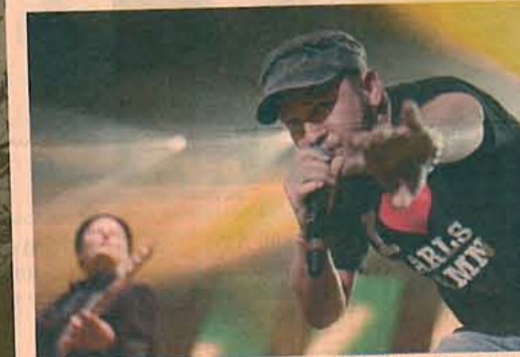
SELGER PÅ NETT. Elektronika-pop-bandet Diskotek har gitt ut sitt første album kun for nedlasting og streaming.