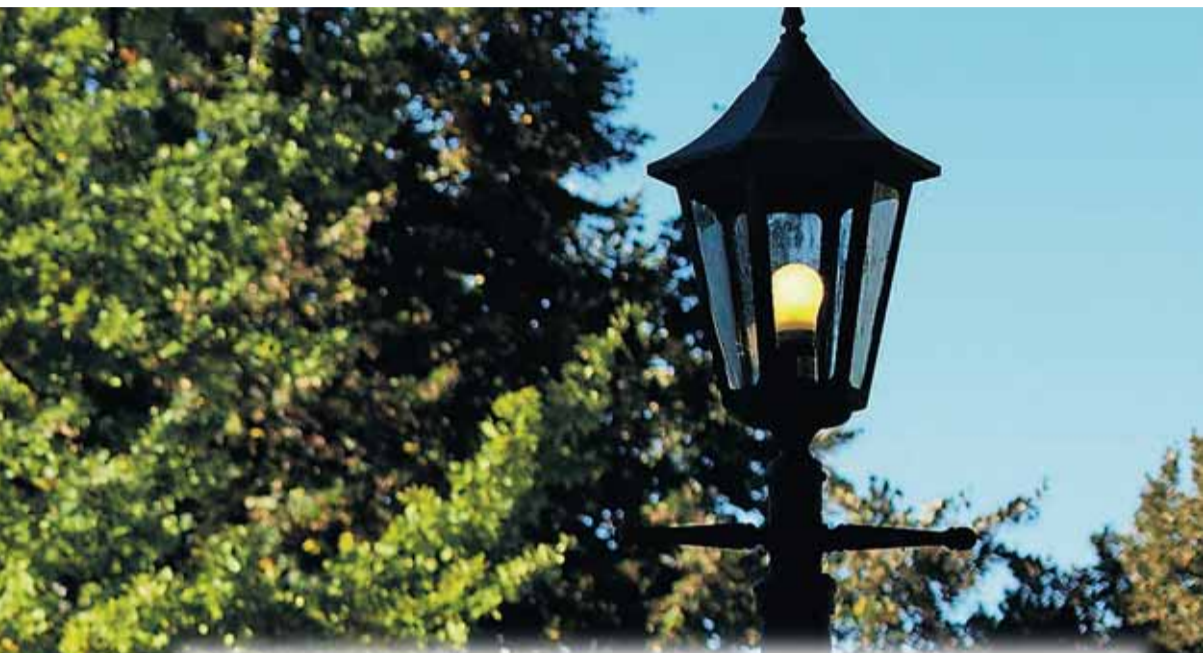
Av STEIN ØSTBØ og MAGNUS KNUITSEN (foto)

! I fjor ble det etablert et eget avhopperforum på nettet til hjelp for alle som har vært medlem av Jehovas vitner eller andre religiøse grupperinger. Personene bak www.avhopperforum.org har selv erfaring fra slike grupperinger og stiller frivillig opp for å svare på spørsmål eller rettledede andre.