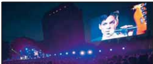
CELEBERT VITNE: Norgesaktuelle Prince, som spiller i Bergen 18. oktober, er medlem av Jehovas vitner. Her fra Roskildefestivalen i sommer.

Etter popkongens død er imidlertid hans barn flere ganger blitt observert på vei til ulike Kingdom Hall – Rikets Sal, kirkebygget til Jehovas vitner – med salmeboken «Sing Praises to Jehova» under armen.